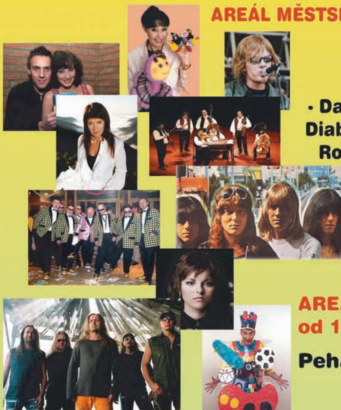
Změna programu vyhrazena

Vstupné v areálu MSH denně 50 Kč děti do 10 let zdarma