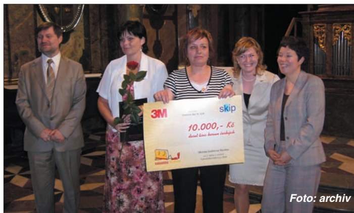
Zástupci Městské knihovny Havířov převzali ocenění za třetí místo v soutěži v Zrcadlové kapli pražského Klementína.

Obrovským úspěchem se může pochlubit Městská knihovna Havířov. V konkurenci 106 knihoven s dětským oddělením získala třetí místo v celostátní soutěži Kamarádka knihovna.