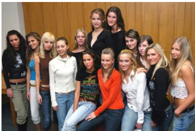
Finalistky a dvě náhradnice před soutěží.