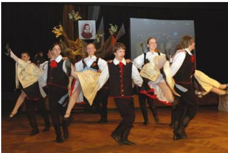
Slavnostní večeře svým vystoupením oslavil folklórní soubor Břidčeviané