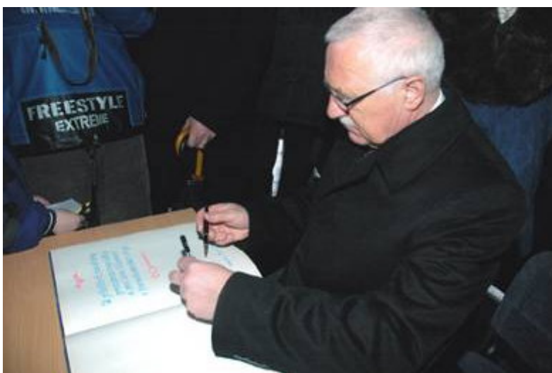
Ještě podpis do pamětní knihy...