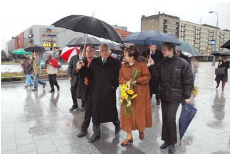
Na náměstí Republiky.