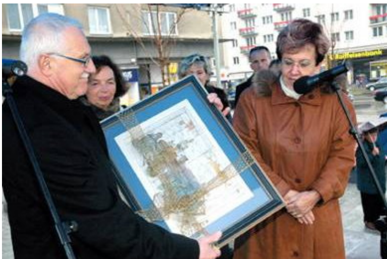
Paní primátorka předala prezidentovi darem grafický list s vyobrazením Havířova od Pavla Hlavatého