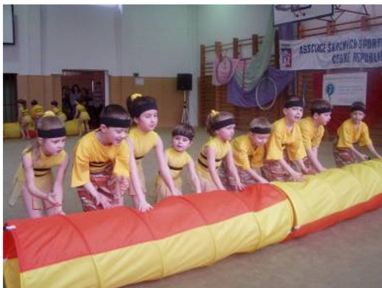
Všchny přitomě nadhly dít se skladbou Vélka Májka