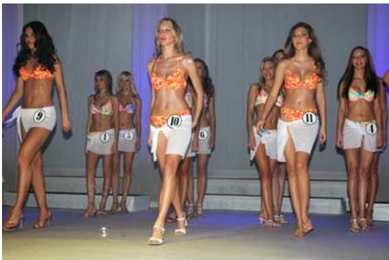
Diváků oblíbená soutěžní přehlídka v plavkách.