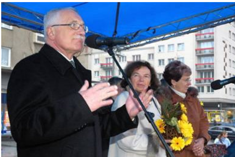
Pan prezident při krátkém projevu na náměstí Republiky.