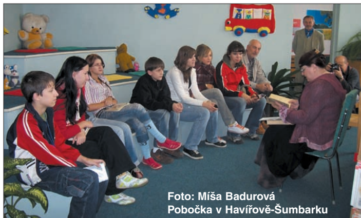
Pobočka v Havířově-Šumbarku

Pro letošní rok byl Týden knihoven prezentován jako knihovnická bašta. Někteří to pochopili po svém a vařili čtenářům kávu a podávali k ní něco sladkého na zub, jiní to vzali jako baštu pro potěchu duše. Havířovská knihovna nikdy nezůstává pozadu. Populární je v první řadě knihovnická amnestie, kterou využívají nepořádní dlužníci, nejen u nás, ale ve většině knihoven v celé republice.