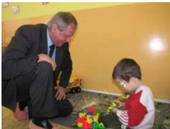
Primátor Zdeněk Osmanczyk