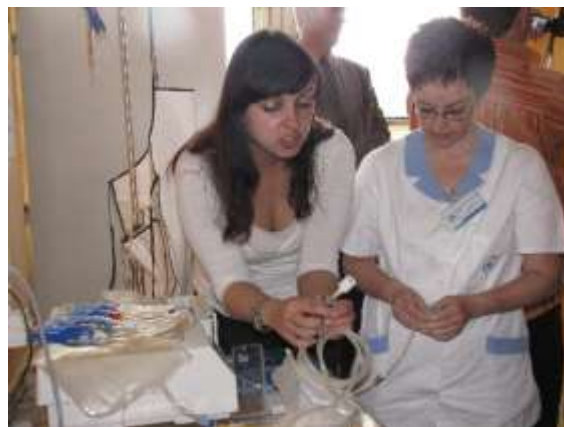
Den zdraví byl pestrý