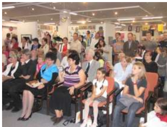
Publikum na vernisáži