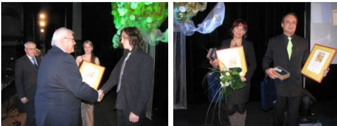
Slavnostní večer ve Společenském domě