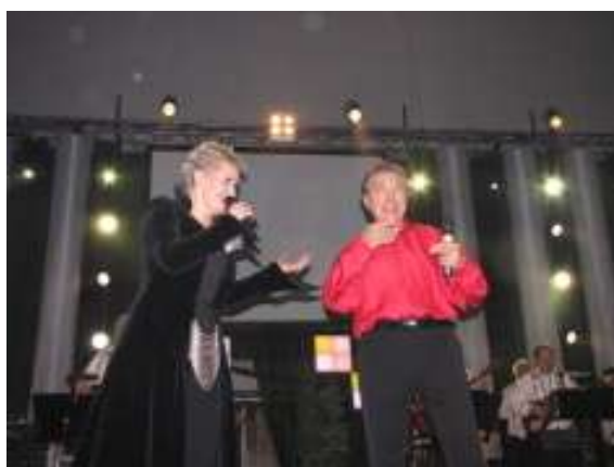
Eva Urbanová a Karel Gott