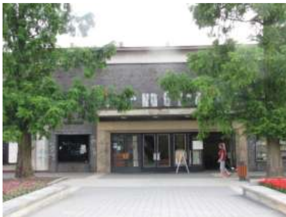
Kino Centrum před rekonstrukcí