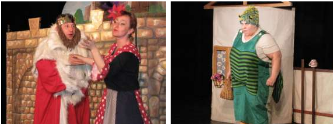
Loutkový sál KD Petra Bezruče