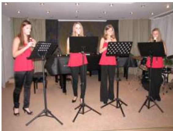
Kvarteto zobcových fléten