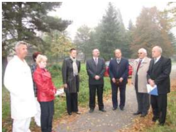
Zahájení slavnostního aktu