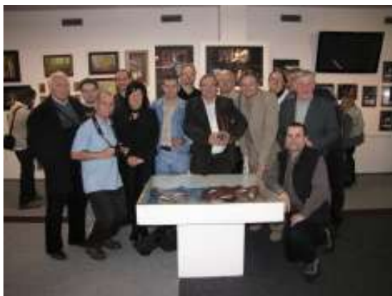
Členové havířovského fotoklubu