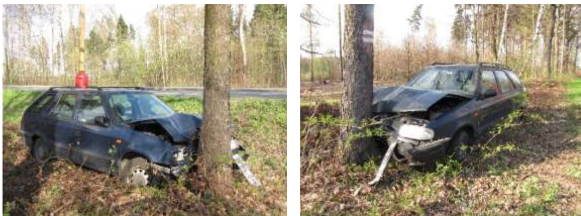
Ulice 17. listopadu