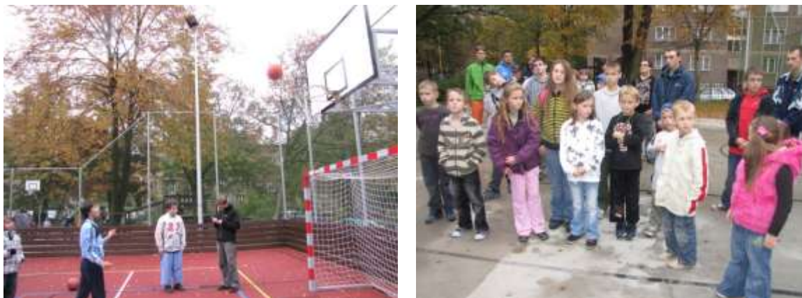
Multifunkční hřiště pro děti a mládež v Haškově ulici