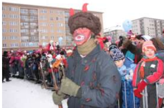
Slavil se také Mikuláš