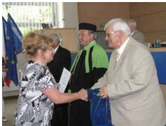
V aule vysoké školy