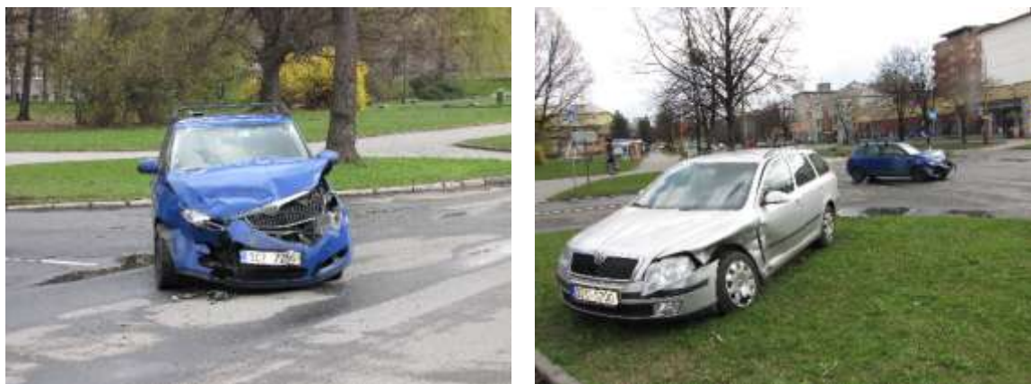
Křižovatka Dlouhá třída a ulice Matušková