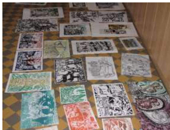
Obrázky před hodnocením