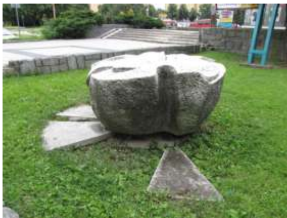
Květ před OD Permon

Zbigniev Dudek: Neraň mé srdce , (Havířov-Město, Centrální park)