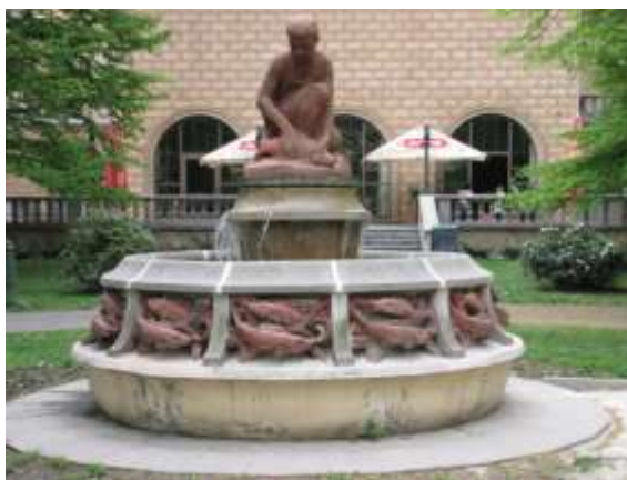
Kašna – Hoch s rybou