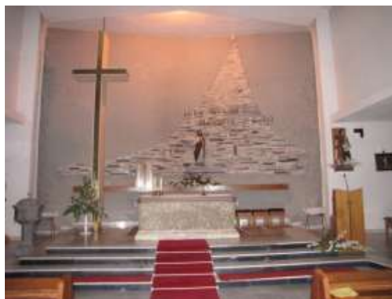
Oltář kostela sv. Anny