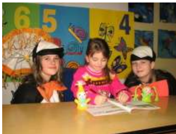
Zápis na ZŠ Moravská