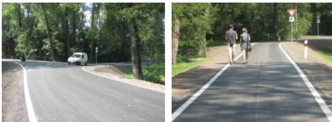
Cesta po protipovodňovém valu

Cesta, která kdysi vedla kolem mlýna, byla neprůjezdná od loňska, když se na pravém břehu budovala protipovodňová hráz. Stavba je již dokončena. Vozovka nyní vede po protipovodňovém valu. To však neznamená, že bude průjezdná i v době vysoké vody. Val je úmyslně snížen před mostem přes řeku Lučinu, aby ve sníženém místě mohla protékat voda, kterou nebude stačit odvádět koryto. Taková situace se projevila při nedávných záplavách. Ještě nedokončená hráz už dokázala bránit vodě ve vylití na fotbalové hřiště a do areálu letního koupaliště. Po nové silnici se dá dojet nejen na levý břeh Lučiny do Šenova, ale také k fotbalovému hřišti ČSAD.