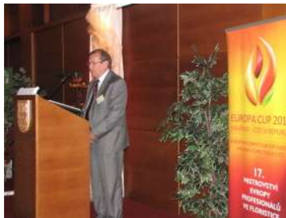
Odborná konference v Kulturním domě Radost