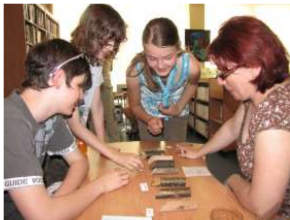
Knihovna v ulici Jaroslava Seiferta