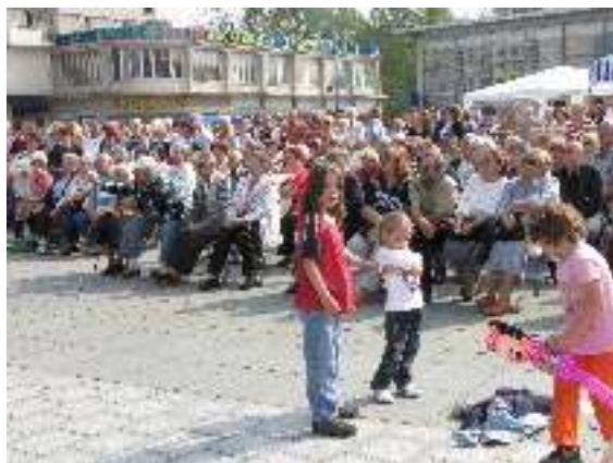
Oslavy na náměstí Republiky