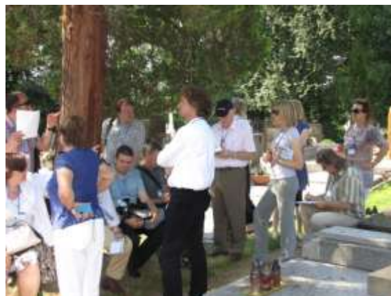
Katolický hřbitov u kostela sv. Markéty