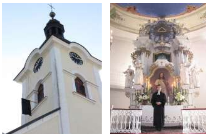
Evangelický kostel v Havířově-Bludovicích

minutou ticha. Rovněž na víkendových bohoslužbách byly proslovy a věřící vyjádřili lítost nad mrtvými. V poledne se rozezněly na některých místech kostelní zvony.