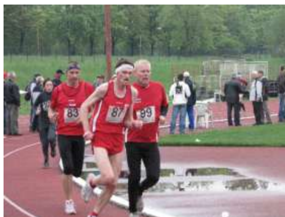
Atletická dráha Slavia Havířov