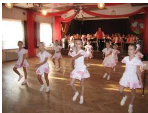
Prostory Domu PZKO patřily mažoretkám