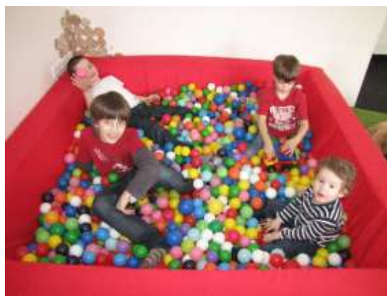
Rodinné centrum Majáček