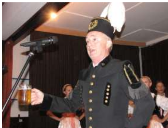
Dožínky v Domě PZKO