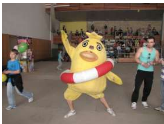
Velký sál Městské sportovní haly