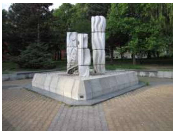
Fontána U Jitřenky