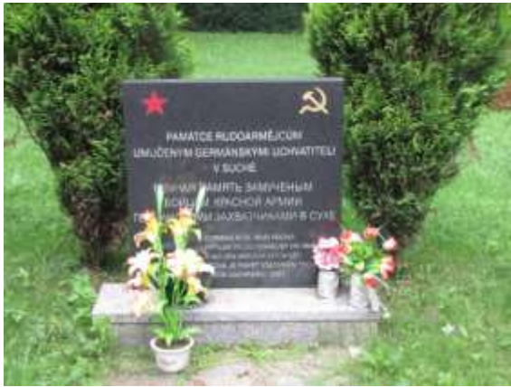
Pomník obětem hitlerovského fašismu

Adolf Kubiczek: Pomník obětem hitlerovského fašismu (Havířov-Prostřední Suchá, hřbitov), Pomník neznámého vojína (Havířov-Životice, ul. Přátelství), Pomník k osvobození obce Dolní Datyně (Havířov-Dolní Datyně, Občanská, před Matěrkou školou).