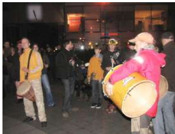
Bubnování pro zdraví na náměstí Republiky