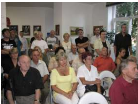
Piéta ve Spirále

V letech 1951 až 1956 vystudoval Vysokou školu výtvarných umění v Bratislavě. Žil a tvořil v Havířově a Ostravě. Zúčastnil se řady samostatných i kolektivních výstav doma i v zahraničí. Byl členem výtvarného seskupení Sušská paleta. V roce 2003 byl oceněn za tvůrčí uměleckou činnost osobností kultury města Havířova. Zemřel 25. července.