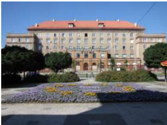
Před KD Radost