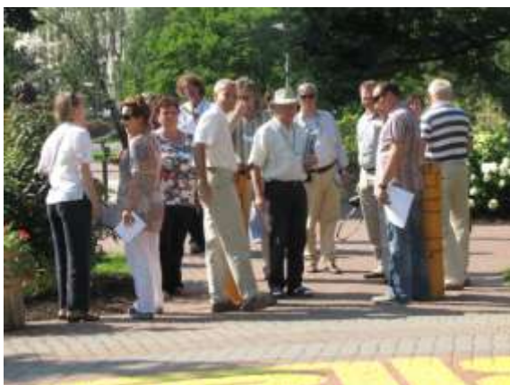
V Centrálním parku