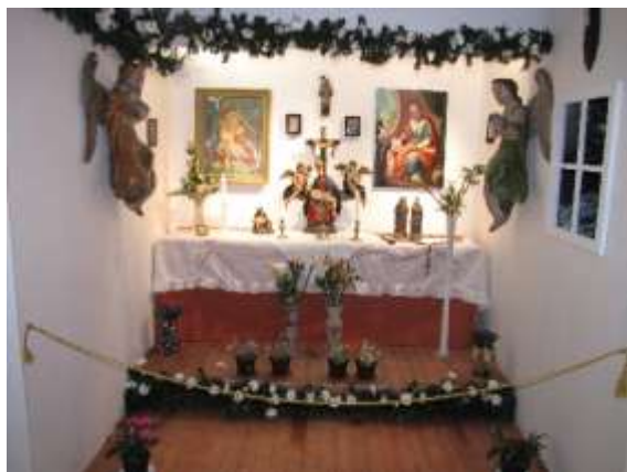
Výstava v Památníku životické tragédie