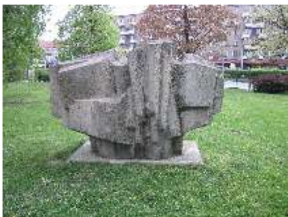
Centrální park, Kniha