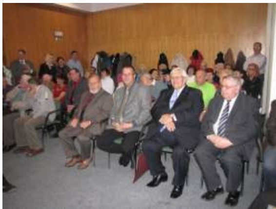
Slavnostní zahájení výstavy