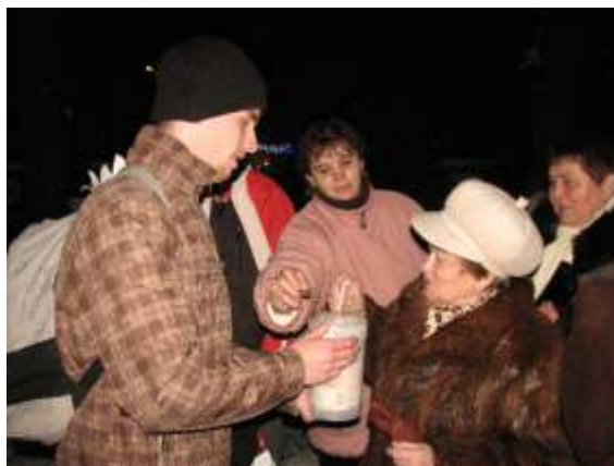
U kostela sv. Anny