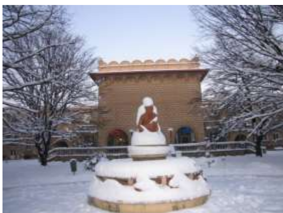
Za KD Radost