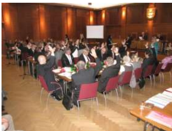
Ustavující schůze zastupitelstva