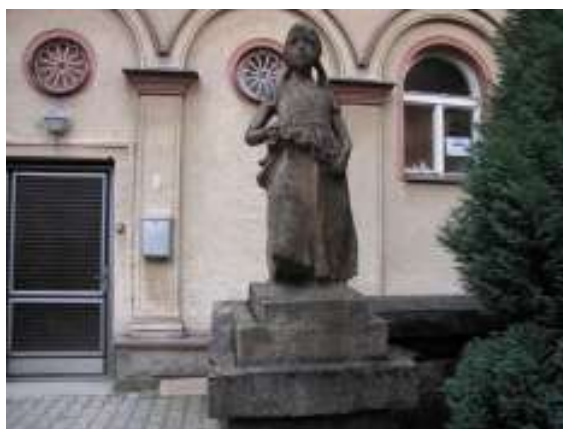
Dívka s věncem