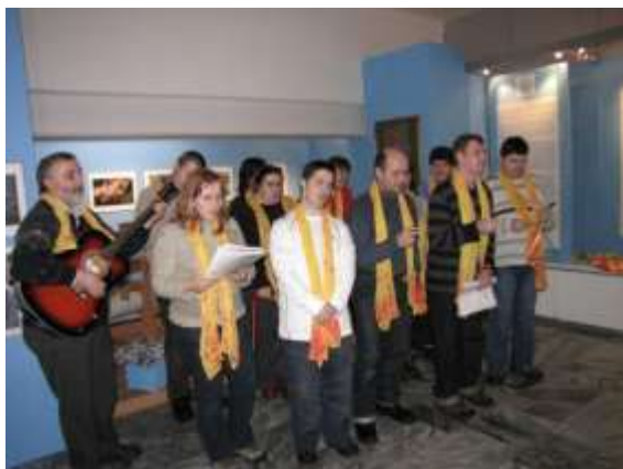
Kulturní program na vernisáži

i jako inspirace pro zájemce, kteří by se chtěli přidat, ať již ke Slezské diakonii, nebo k SPMP. Výstava potrvá do 11. dubna 2010.