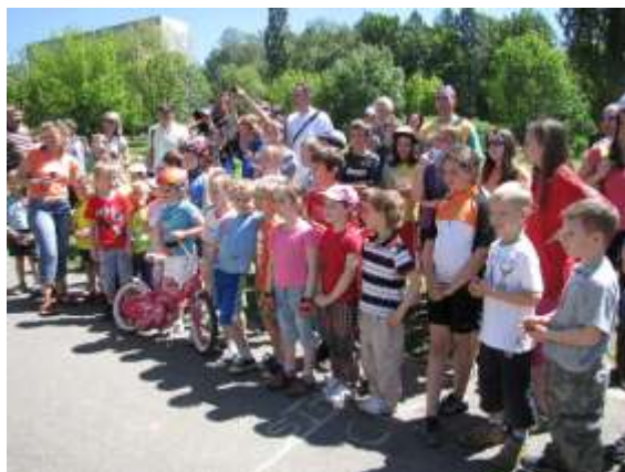
Park pod KD Leoše Janáčka