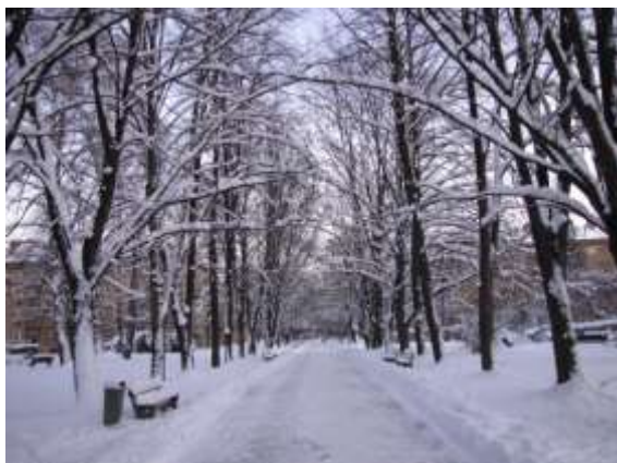
Ulice V parku