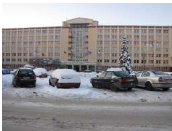
Magistrát města Havířova