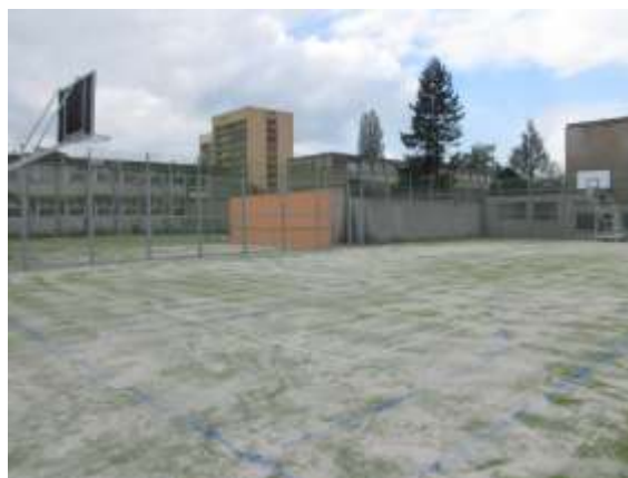
Sportovní areál v ulici Tajovského