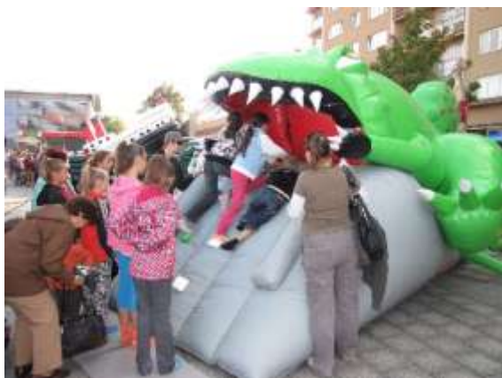
Program na náměstí Republiky