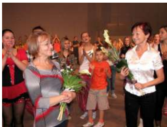
Galapředstavení v Městské sportovní hale