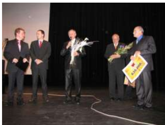
Benefiční koncert havířovské Nemocnice s poliklinikou