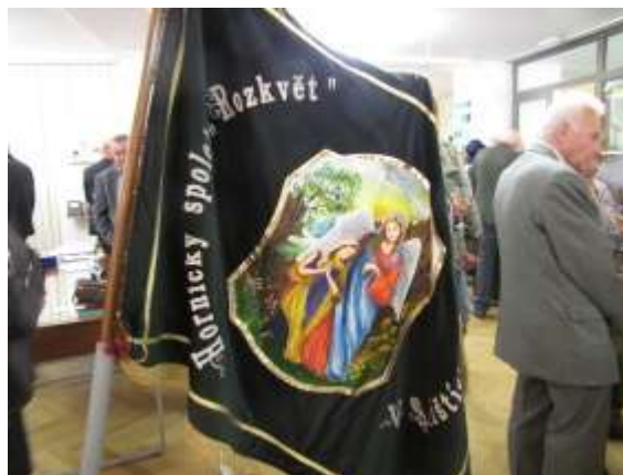
Vernisáž v Kulturním domě Radost