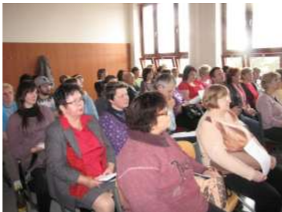
Přednáška v KD Petra Bezruče