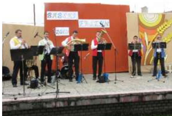
Zahradu Domu PZKO ovládl folklor