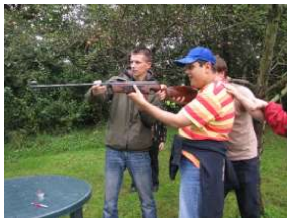
Zahrada Sboru Apoštolské církve v Selské ulici