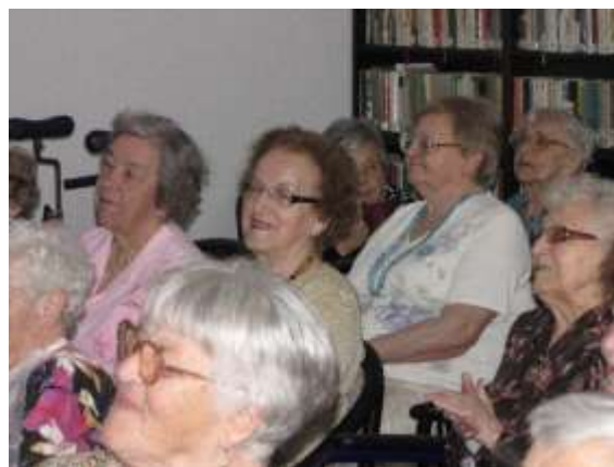
Pestrý program předvedly děti ze ZŠ Moravská