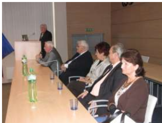
Představitelé města a školy