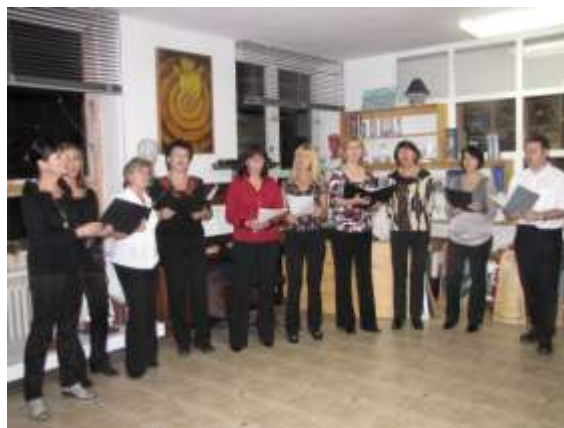
Výtvarníci a zpěváci