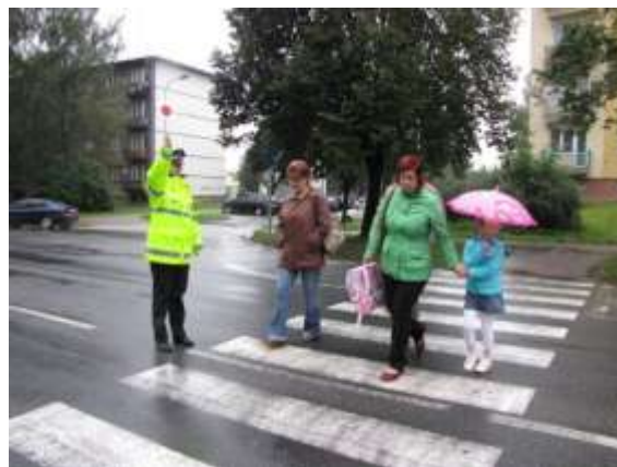
Přechod na ulici 17. listopadu