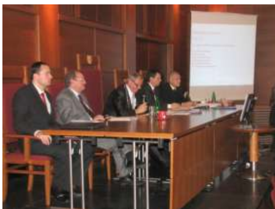
Nové vedení města