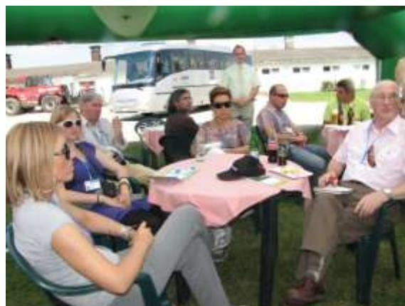
Na statku v Bludovicích