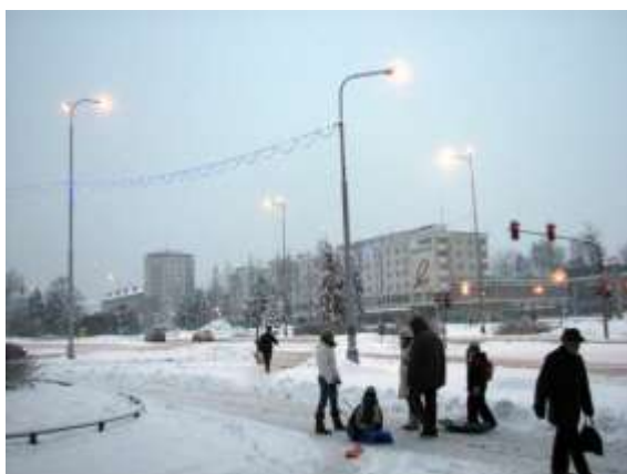
Pohled na náměstí Republiky