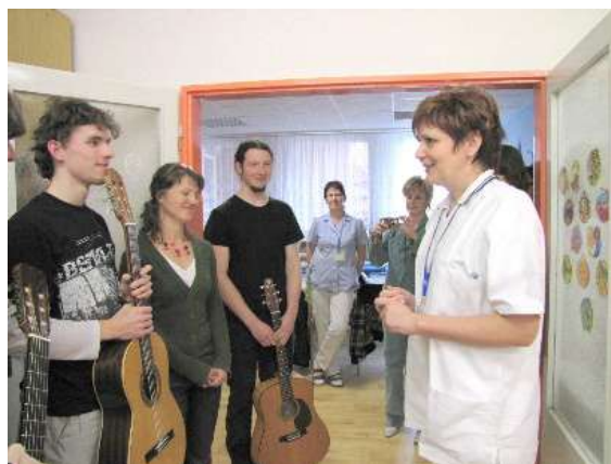
Hlavní aktéři na dětském oddělení