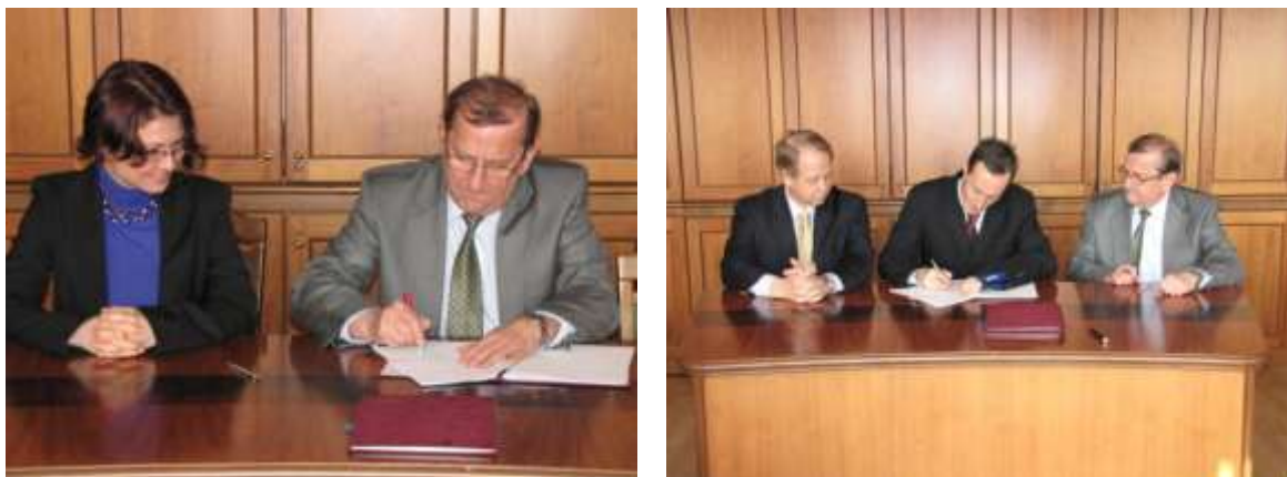
Zasedačka Rady města Havířva