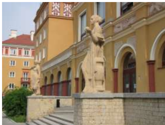
Jaroslav Brož: Ležící žena (Havířov-Podlesí, Karolíny Světlé, před restaurací Luna)