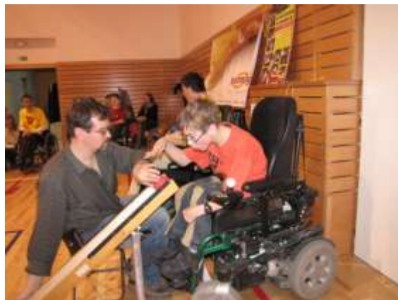
Tělocvična Střediska volného času sv. Jana Boska