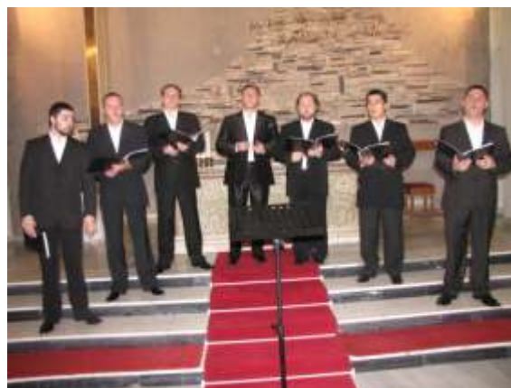
Sbor Ipatjevského mužského kláštera v kostele sv. Anny