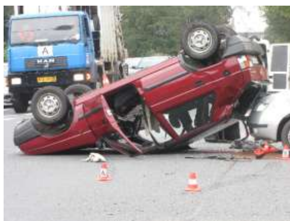
Křižovatka ulic Mánesová, 17. listopadu a Studentská