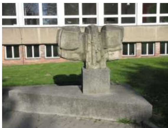
Ulice Studentská, Kniha