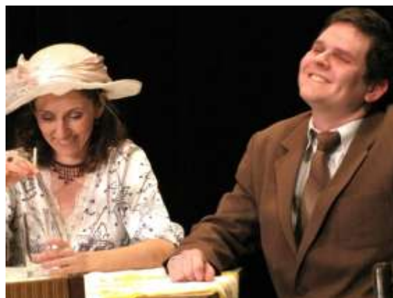
Na jevišti loutkového sálu KD Petra Bezruče