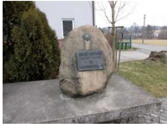
Pomník k osvobození obce Dolní Datyně