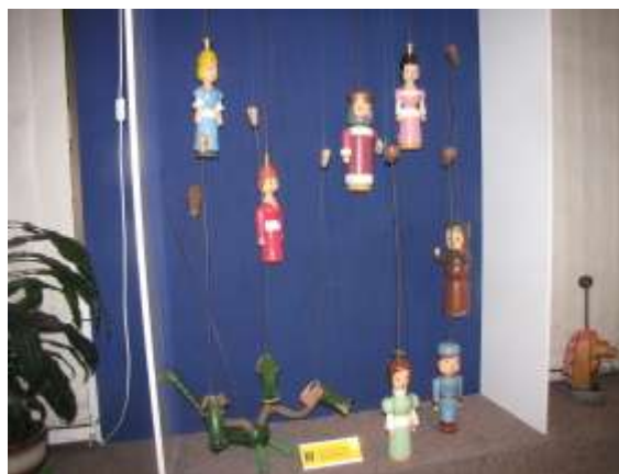
Výstavní síň Musaion