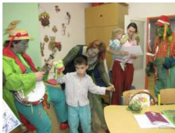
Dětské oddělení havířovské nemocnice