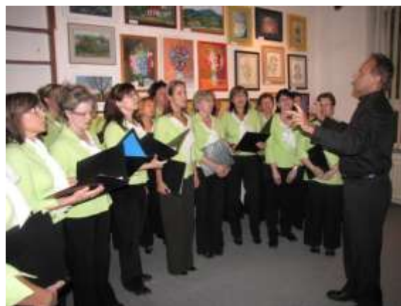
Ženský pěvecký sbor Canticorum