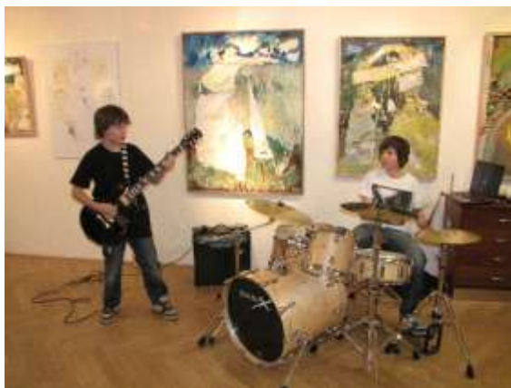
Vernisáž v KD Radost