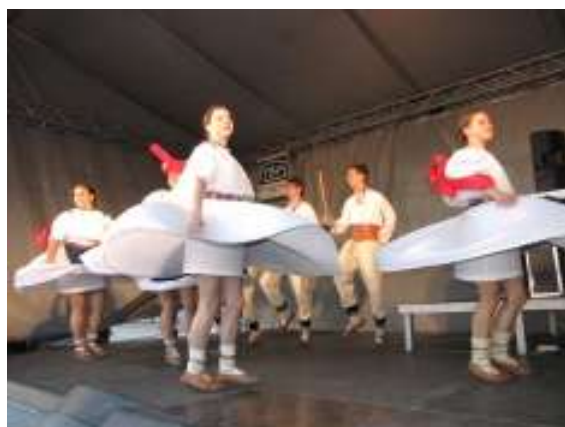
Velikonoční městečko bylo plné zpěvu a tance