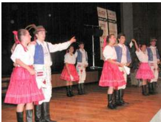
Vonička v městě Łukowa