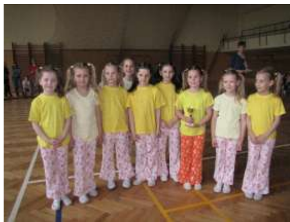
Tělocvična krytého plaveckého bazénu