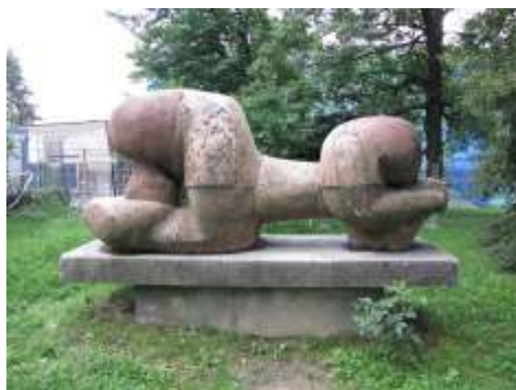
Ležící žena – žal