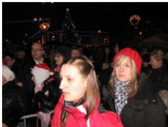
Půlnoční na náměstí Republiky