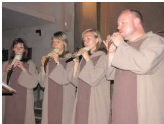
V kostele sv. Anny