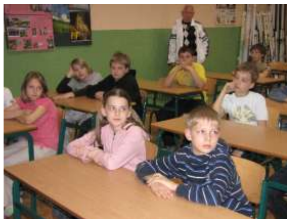
Preventivní prezentace v 5. B třídě Základní školy Františka Hrubína