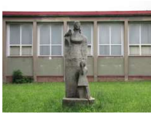
Žena s holubicí a dítětem

Jan Kavan: Sedící žena s kvítkem (Havířov-Město, Národní třída)