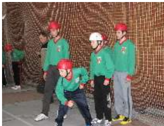
Start běžecké štafety