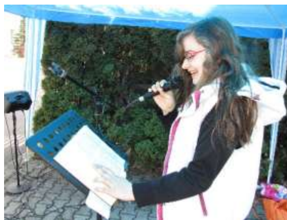
U ZŠ Gen. Svobody