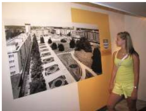
Havířov před Havířovem

Na patnácti panelech prezentuje prostřednictvím dobového ikonografického materiálu zásadní proměnu obcí Životice, Šumbark, Horní a Prostřední Suchá, Dolní Datyně, Dolní Bludovice, tedy těch, na jejichž katastru vyrostlo na přelomu čtyřicátých a padesátých let 20. století současné statutární město Havířov. Svým pojetím chce poukázat na opomíjené aspekty vývoje jednoho z nejmladších a zároveň největších měst České republiky. Výstavu připravilo Muzeum Těšínska. Expozice bude ke zhlédnutí do 17. července 2011.