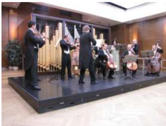
Janáčkův komorní orchestr