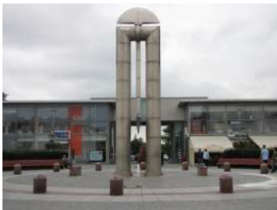
Jiří Myszak: Chlapec s míčem a dívka s věncem (Havířov-Město, MŠ Sadová), Horník s hochem (Havířov-Město, terasa ZŠ Na nábřeží), Žena s dítětem