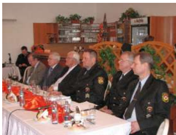
Zástupci města a městské policie