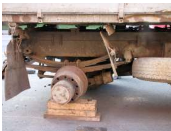
Ulice 17. listopadu