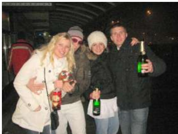
Vítání nového roku

Spoušť, která každoročně po silvestrovské oslavě v ulicích zůstává, začali pracovníci Technických služeb Havířov uklízet ještě v noci.