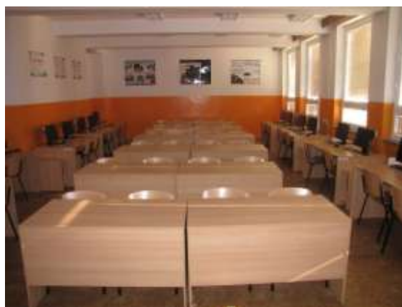
Učebna na ZŠ 1. máje

Jedná se o 3 projekty, které jsou plně hrazeny z dotací. Skoro 40 milionů korun se investuje do počítačových sestav, výukových materiálů, vytvoření sítě e-learningu a odborné učebny pro vzdělávání pedagogů. Tyto náklady jsou hrazeny z 85 % z Evropského sociálního fondu a 15 % jsou spolufinancovány ze státního rozpočtu. Žáci a pedagogové havířovských základních škol mají nyní k dispozici celkem 163 nových počítačů, notebooků, tiskáren, scannerů a další počítačové techniky.