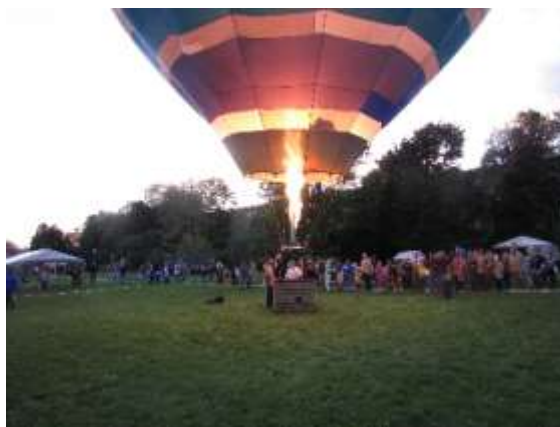
Park za náměstím