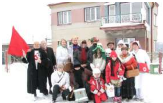
Před budovou knihovny

Hlavními postavami byly stejně jako v předchozích letech členky Amatérského divadla při Českém svazu žen a místní nadšenci.