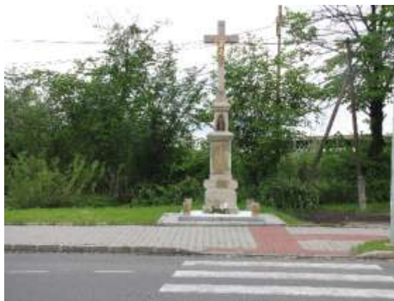
Ulice Padlých hrdinů