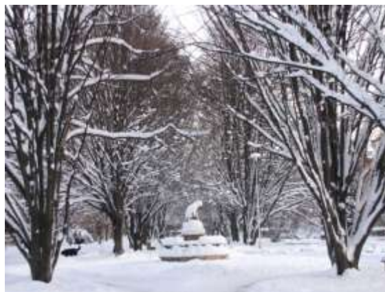
Ulice V parku