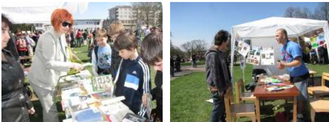
Den Země v centru Havířova