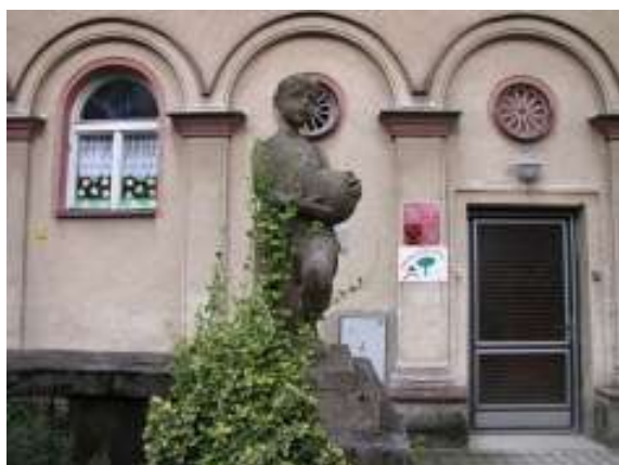
Chlapec s míčem