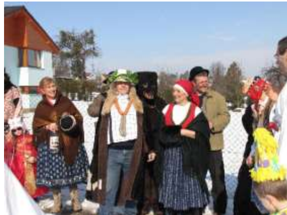
Masopust v Havířově-Bludovicích