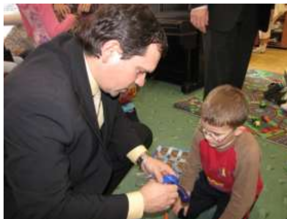
Náměstek primátora Petr Smrček