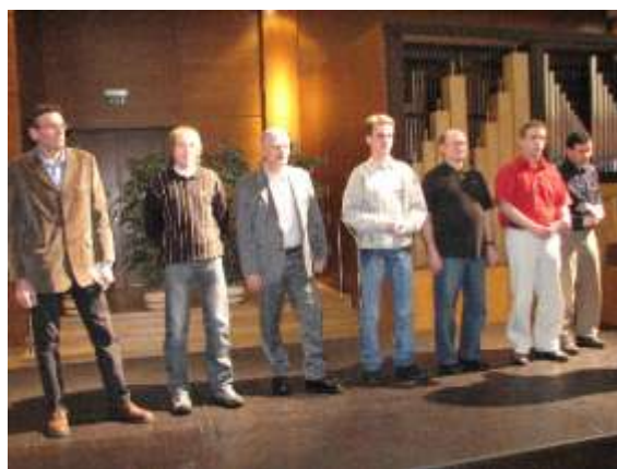
Čestní dárci krve

12. 1. – Lidé byli ke Třem králům štědrí, chyběli koledníci Jubilejní, v pořadí již desátá Tříkrálová sbírka organizovaná Charitou České republiky proběhla v uplynulých dnech také v Havířově. Letos se vykoledovalo 70 476 korun.