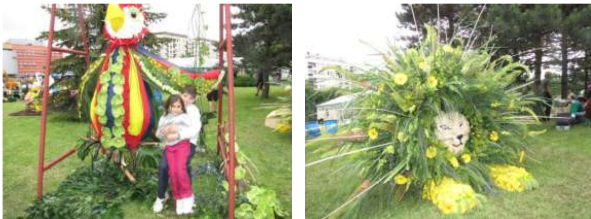
Havířov v květech