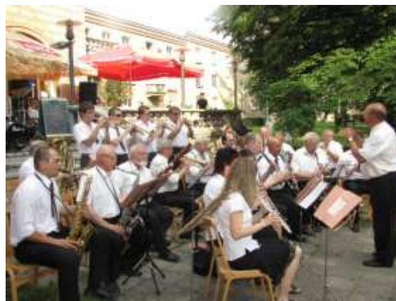
Koncert Azeťanky za KD Radost