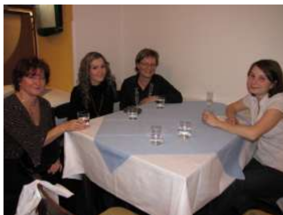
Knihovnice a hosté