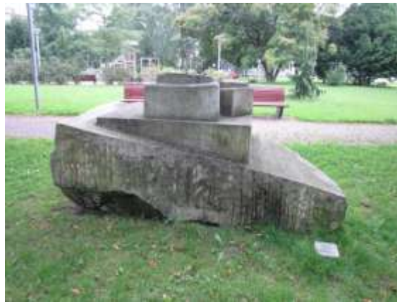
Ambrož Špetík: Objekt (Havířov-Podlesí, Dlouhá třída)