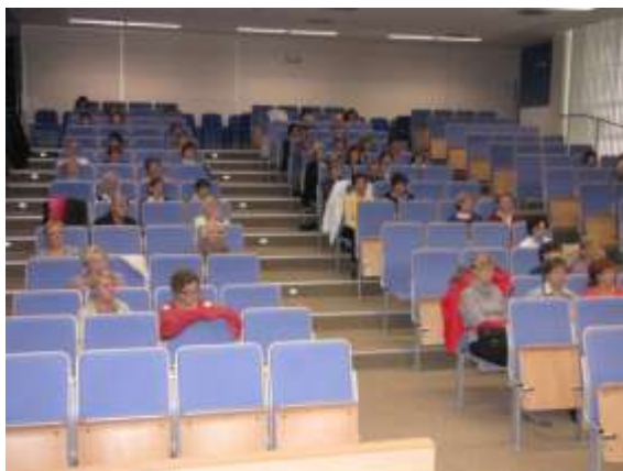
Aula Vysoké školy sociálně správní