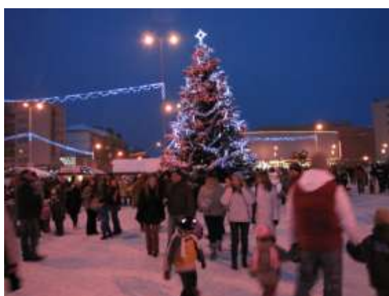
Vánoční strom na náměstí Republiky