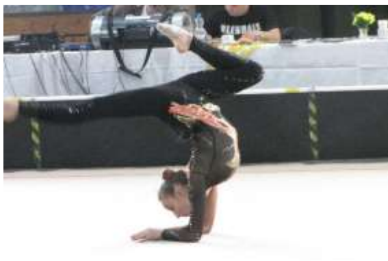
Cvičení bez náčiní