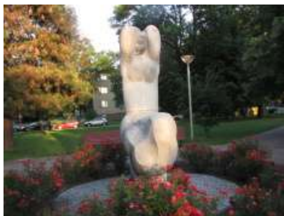
Centrální park, Sedící žena,