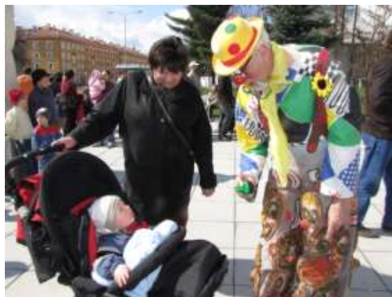
Před zahájením představení