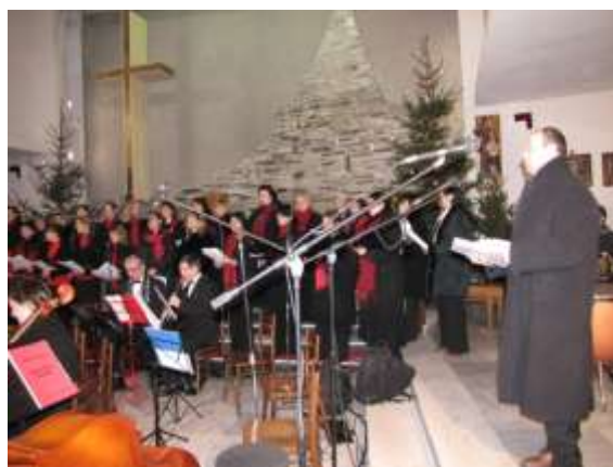
Česká mše vánoční od Jakuba Jana Ryby v kostele sv. Anny