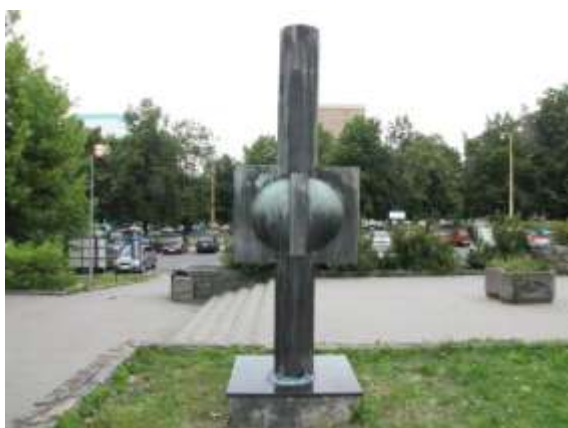
Bronzová plastika před OD Permon