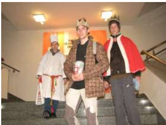
Magistrát města Havířova

Výtěžek Tříkrálové sbírky je určen především na pomoc nemocným, handicapovaným, seniorům, matkám s dětmi v tísní a dalším, jinak sociálně potřebným skupinám lidí a to zejména v regionech, kde se sbírka koná. Přibližně desetina výnosu je určena na humanitární pomoc do zahraničí. Letos se v Havířově vykoledovalo 70 746 korun. V minulém roce to bylo o čtyři tisíce více.