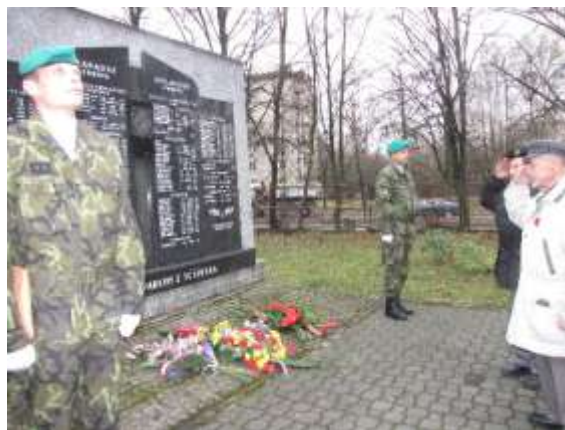
Pietní akt u kostela sv. Anny

Dne 11. listopadu 1918 v 11.01 hodin podepsal maršál Foch v železničním vagónu v Compiègne na řece Marne příměří s poraženým Německem císaře Viléma. Tímto historickým aktem bylo rozhodnuto o ukončení 1. světové války.