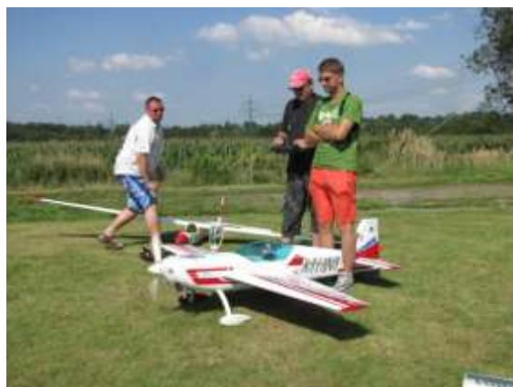
Klubové letiště Hohenegger