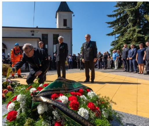
Pietní akt u pamětní desky 108 horníkům, kteří zahynuli 7. července 1961 při důlním neštěstí na Dole Dukla.