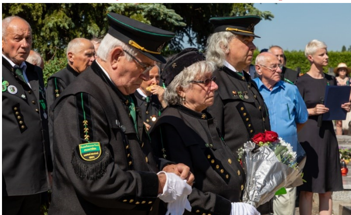
Pietní akt u pamětní desky 108 horníkům, kteří zahynuli 7. července 1961 při důlním neštěstí na Dole Dukla.