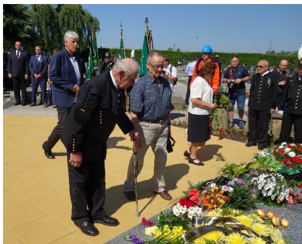
Pietní akt u pamětní desky 108 horníkům, kteří zahynuli 7. července 1961 při důlním neštěstí na Dole Dukla.