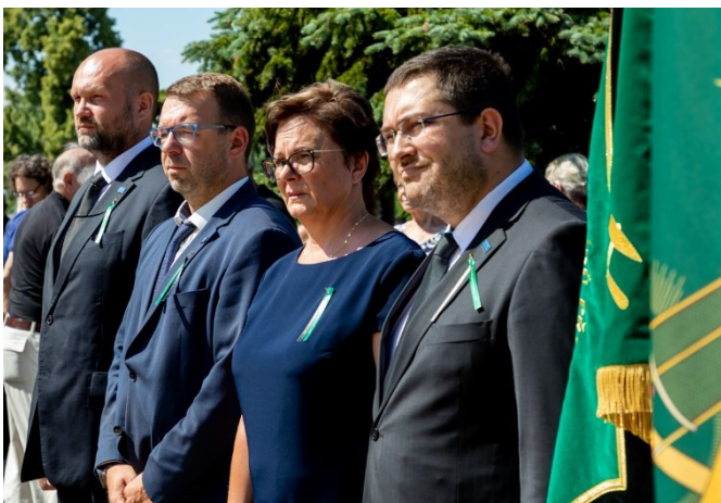
Pietní akt u pamětní desky 108 horníkům, kteří zahynuli 7. července 1961 při důlním neštěstí na Dole Dukla.