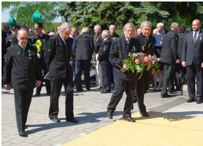
Pietní akt u pamětní desky 108 horníkům, kteří zahynuli 7. července 1961 při důlním neštěstí na Dole Dukla.