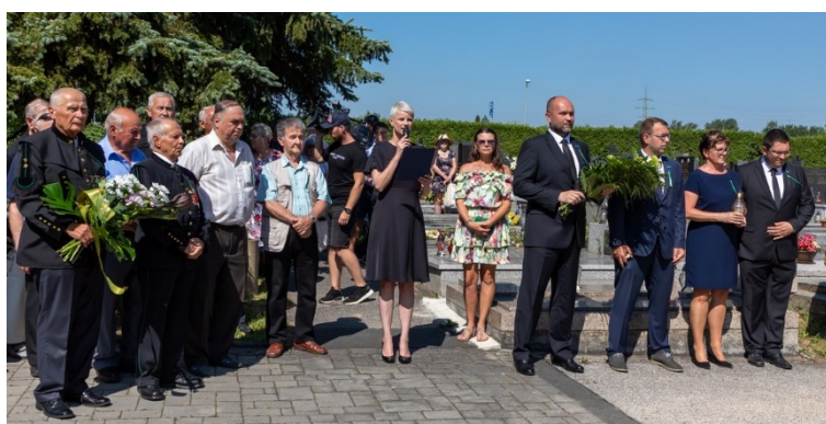
Pietní akt u pamětní desky 108 horníků, kteří zahynuli 7. července 1961 při důlním neštěstí na Dole Dukla. Poklonit se přišli představitelé vedení města Havířova.