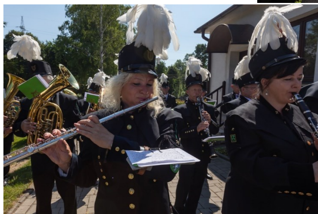
Pietní akt u pamětní desky 108 horníkům, kteří zahynuli 7. července 1961 při důlním neštěstí na Dole Dukla.