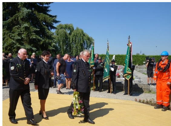
Pietní akt u pamětní desky 108 horníkům, kteří zahynuli 7. července 1961 při důlním neštěstí na Dole Dukla.