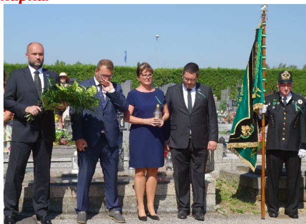
Pietní akt u pamětní desky 108 horníků, kteří zahynuli 7. července 1961 při důlním neštěstí na Dole Dukla.