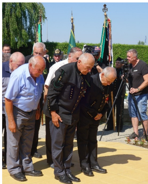
Pietní akt u pamětní desky 108 horníkům, kteří zahynuli 7. července 1961 při důlním neštěstí na Dole Dukla.