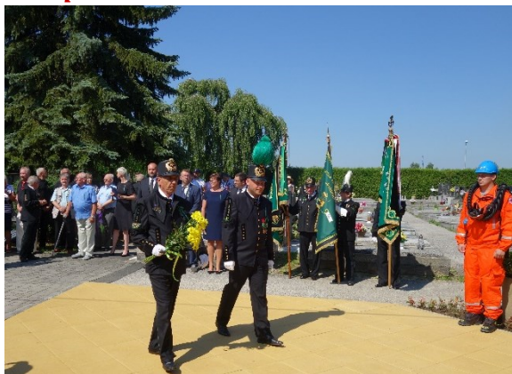
Pietní akt u pamětní desky 108 horníkům, kteří zahynuli 7. července 1961 při důlním neštěstí na Dole Dukla.