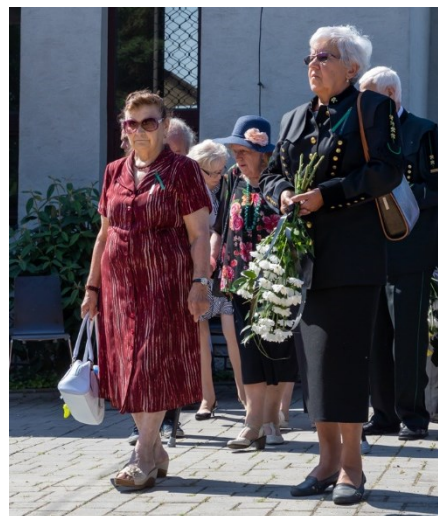
Pietní akt u pamětní desky 108 horníkům, kteří zahynuli 7. července 1961 při důlním neštěstí na Dole Dukla.