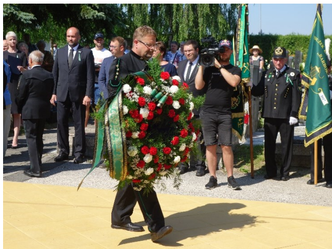
Pietní akt u pamětní desky 108 horníkům, kteří zahynuli 7. července 1961 při důlním neštěstí na Dole Dukla.