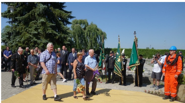
Pietní akt u pamětní desky 108 horníkům, kteří zahynuli 7. července 1961 při důlním neštěstí na Dole Dukla.