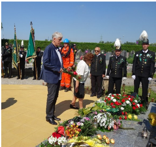
Pietní akt u pamětní desky 108 horníkům, kteří zahynuli 7. července 1961 při důlním neštěstí na Dole Dukla.