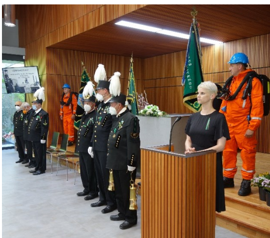
Pietní akt ve smuteční síni, připomínka 108 horníků, kteří zahynuli 7. července 1961 při důlním neštěstí na Dole Dukla.