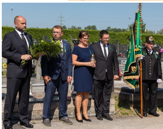
Pietní akt u příležitosti 60. výročí neštěstí na Dole Dukla u pamětní desky se jmény 108 horníků, kteří zahynuli 7. července 1961. Památník byl přestěhován z průmyslové zóny Dukla v roce 2020.