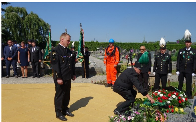
Pietní akt u pamětní desky 108 horníkům, kteří zahynuli 7. července 1961 při důlním neštěstí na Dole Dukla.