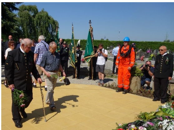
Pietní akt u pamětní desky 108 horníkům, kteří zahynuli 7. července 1961 při důlním neštěstí na Dole Dukla.