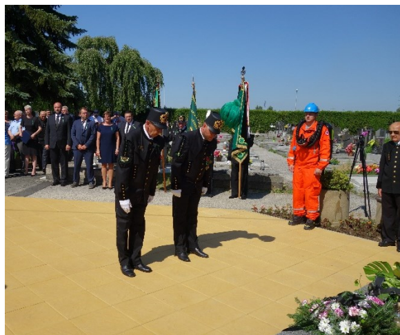
Pietní akt u pamětní desky 108 horníkům, kteří zahynuli 7. července 1961 při důlním neštěstí na Dole Dukla.