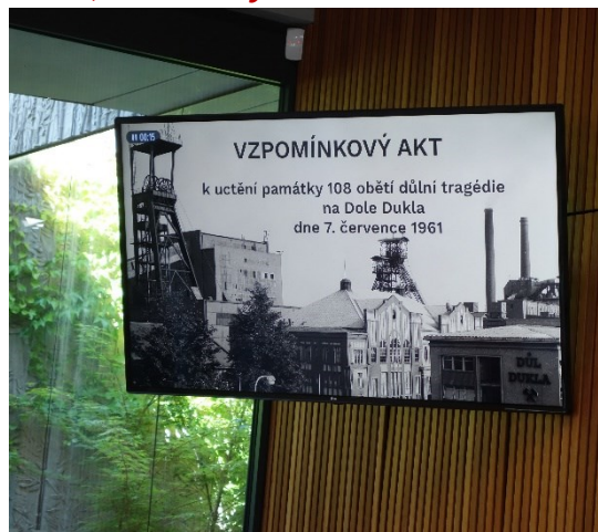
Pietní akt ve smuteční síni, připomínka 108 horníků, kteří zahynuli 7. července 1961 při důlním neštěstí na Dole Dukla.