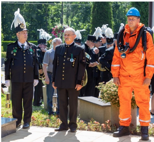
Pietní akt u pamětní desky 108 horníkům, kteří zahynuli 7. července 1961 při důlním neštěstí na Dole Dukla.