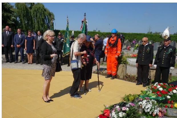
Pietní akt u pamětní desky 108 horníkům, kteří zahynuli 7. července 1961 při důlním neštěstí na Dole Dukla.