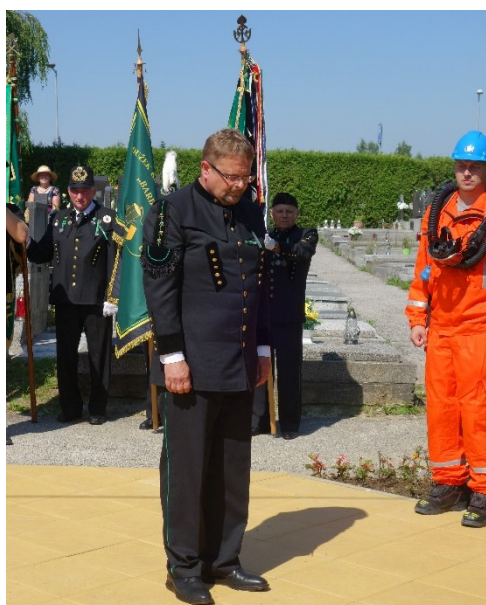
Pietní akt u pamětní desky 108 horníkům, kteří zahynuli 7. července 1961 při důlním neštěstí na Dole Dukla.