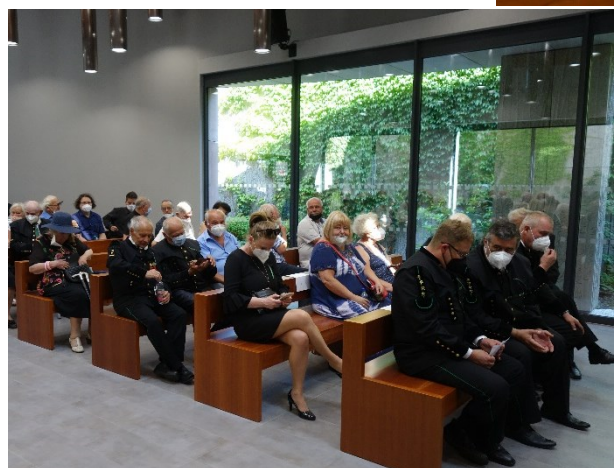
Pietní akt ve smuteční síni, připomínka 108 horníků, kteří zahynuli 7. července 1961 při důlním neštěstí na Dole Dukla.