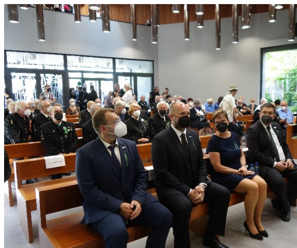
Pietní akt ve smuteční síni, připomínka 108 horníků, kteří zahynuli 7. července 1961 při důlním neštěstí na Dole Dukla.