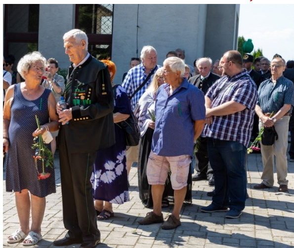
Pietní akt u pamětní desky 108 horníkům, kteří zahynuli 7. července 1961 při důlním neštěstí na Dole Dukla.